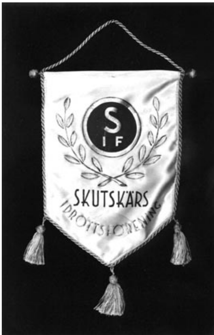
Standar för Skutskärs Idrottsförening. Folkrörelsearkivet för Uppsala län.

nella arenan. Därför är det av vikt att i möjligaste mån bevaka olika idrottsplatsers historia och framtida utveckling. Man kan med fördel vända sig till läns museernas byggnadshistoriska avdelningar eller motsvarande för eventuella frågor.