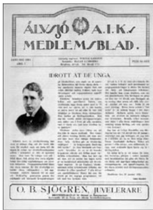
Älvsjö AIK:s medlemsblad, 1921.