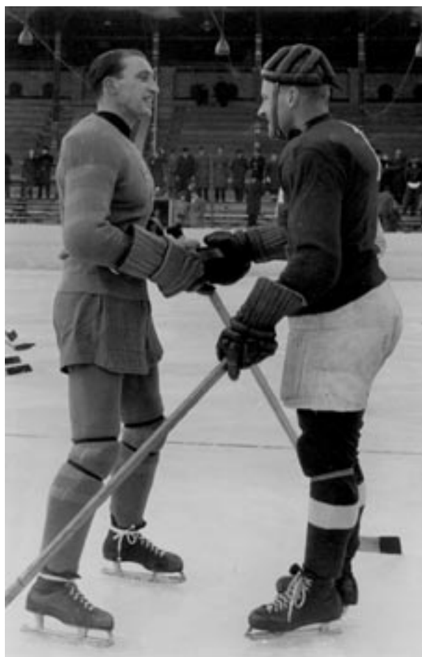
Ishockeymatch mellan Sverige och Schweiz 1946. De båda lagkaptenerna hälsar före matchen.

Plast bör undvikas i samband med slutförvaring av arkivhandlingar. Detta gäller särskilt PVC-plast. Anledningen till detta är att plasten är för tät och dessutom påverkar skriften.