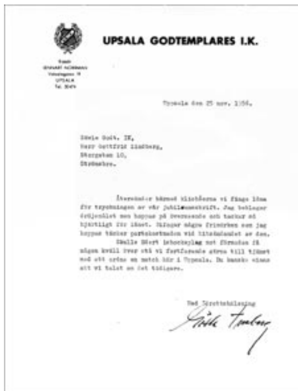
Brev från Upsala Godtemplares IK. 1956. Folkrorelsearkivet för Uppsala län.

rör samma ämne. För att upprätta en dossiéplan går man igenom hela föreningens/förbundets verksamhetsområde och delar in det i ett antal huvudgrupper, t ex administration, ekonomi, utbildning, information. Huvudgrupperna kan i sin tur delas in i undergrupper. Som exempel kan nämnas att Riksidrottsförbundet använder sig av en diarie-/dossiéplan. En dossiéplan är främst att rekommendera för en större organisation.