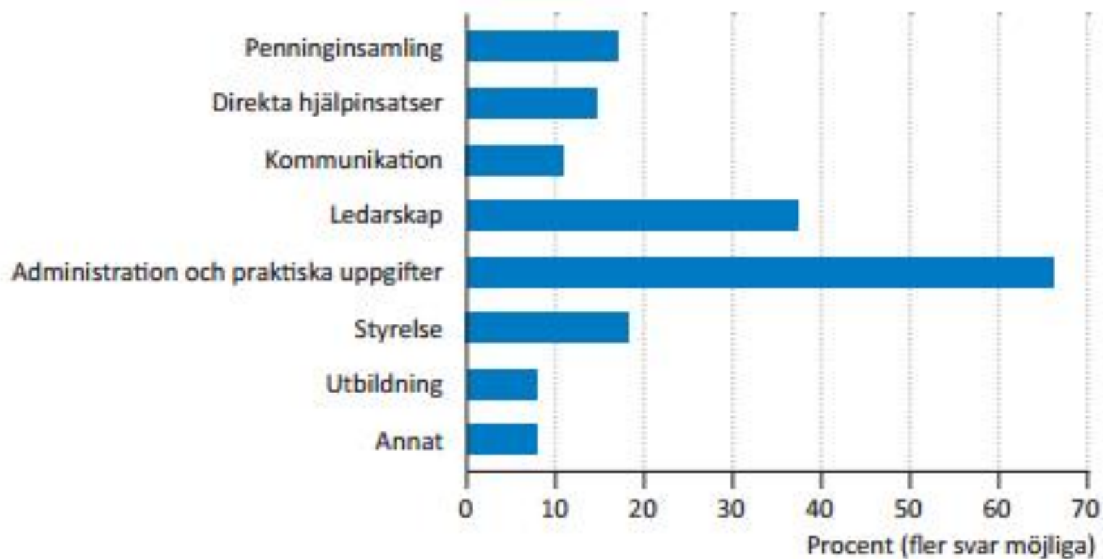
Figur 10. Typer av ideella insatser. Procent av ideellt arbetande inom idrott. N=215. Not: Eftersom varje person kan göra fler än en typ av ideell insats blir summan mer än 100 procent.