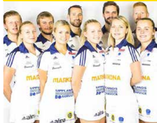
Fyrisfjädern Svenska mästare 2016

Uppsala, Celsiusskolan och Upplands Idrottsförbund är plats för vinnare. Med det menar vi inte att vi är till bara för dig som vill stå överst på pallen en dag. Vinnare är alla som har viljan att nå sin fulla potential inom både skola och idrott. Du kanske går en utbildning och blir en av Sveriges bästa ledare inom din idrott eller helt enkelt lägger idrottsskorna på hyllan och läser vidare inom exempelvis matematik eller ekonomi. Oavsett – du är välkommen om du vill satsa. Vi har skapat en plattform för din framtida karriär.